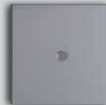
045 BZ Matte Bronze Bronze Mat