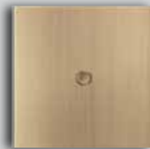
03 VO Old Gold Vieil Or