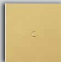
11 OM Matte Gold Or Mat