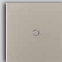
12 NS Microbilled Nickel Nickel Microbillé