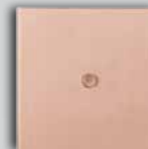
14 RO Brushed Copper Cuivre Brossé