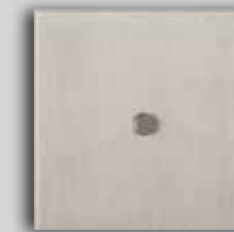
08 NB Brushed Nickel Nickel Brossé