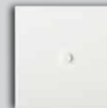
16 RAL Lacquered Laqué