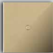
01 LM Mirror Brass Laiton Miroir

Entre personnalisation et finition, LUXONOV propose un choix illimité. Tandis que l'iconique laiton reste un favori grâce aux sublimes patines qu'il permet, une palette de peaux et bois précieux est aussi disponible sur commande. Ces matériaux rares sont sélectionnés en parfait respect des réglementations internationales. Mais ce n'est pas tout. Les clients peuvent aussi soumettre leur propre design, ce qui permet aux produits LUXONOV de pousser plus loin le concept même du "sur mesure".