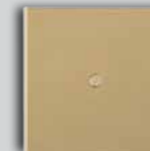
15 LS Microbilled Brass Laiton Mircobillé