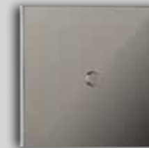
07 NM Mirror nickel Nickel miroir