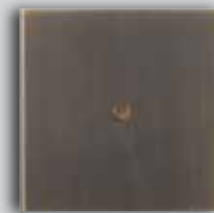
04 BM Medium Bronze Bronze Moyen