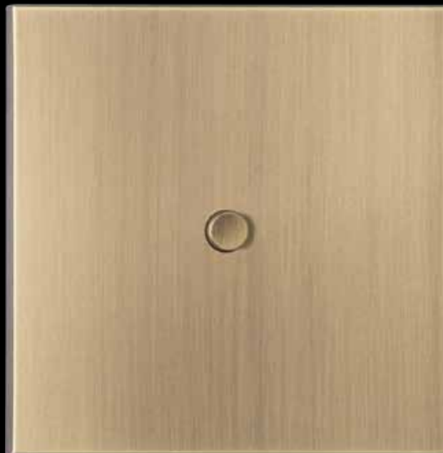
NEVA single panel in 03 VO / Old Gold coating