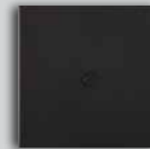
05 BR Dark Glossy Bronze Bronze Noir