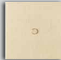
02 LB Brushed Brass Laiton Brossé