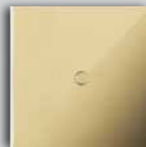
10 OR Gold Or