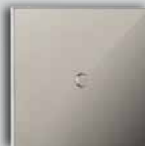
09 CH Mirror Chrome Chrome Miroir